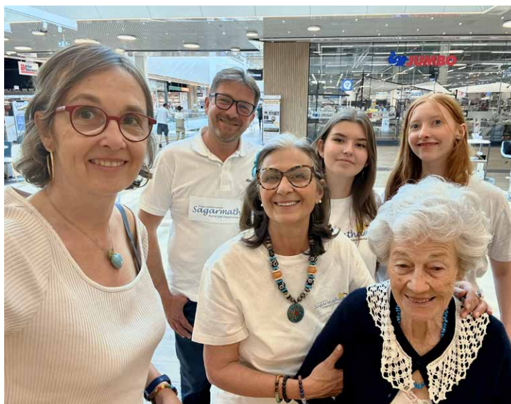
Photos haut et bas: nos bénévoles lors de la Journée de la bonne action 2025 à la Coop d'Allaman.