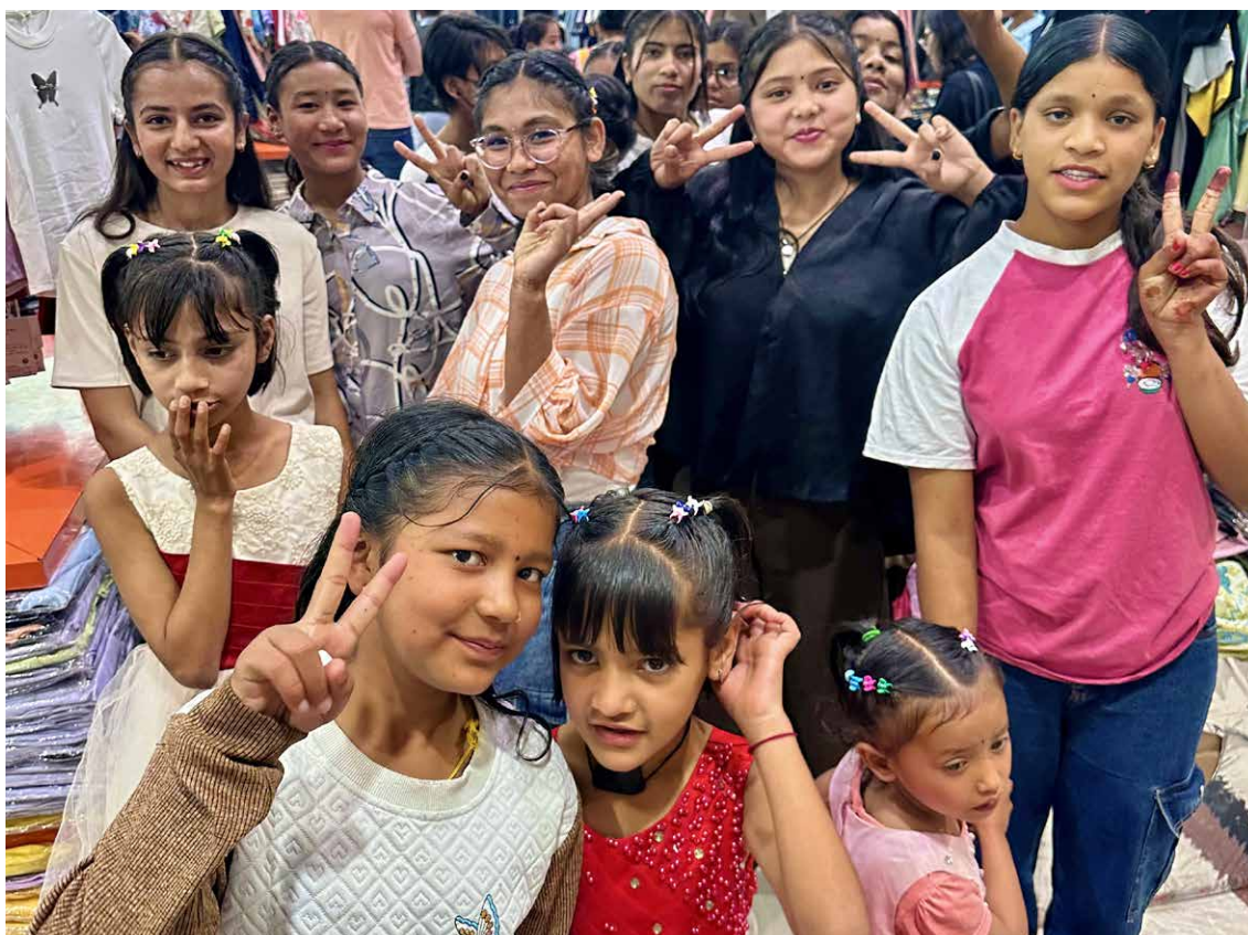
Sortie « shopping » avec les enfants et jeunes du centre Punarbal, lors de notre voyage d'avril 2025.