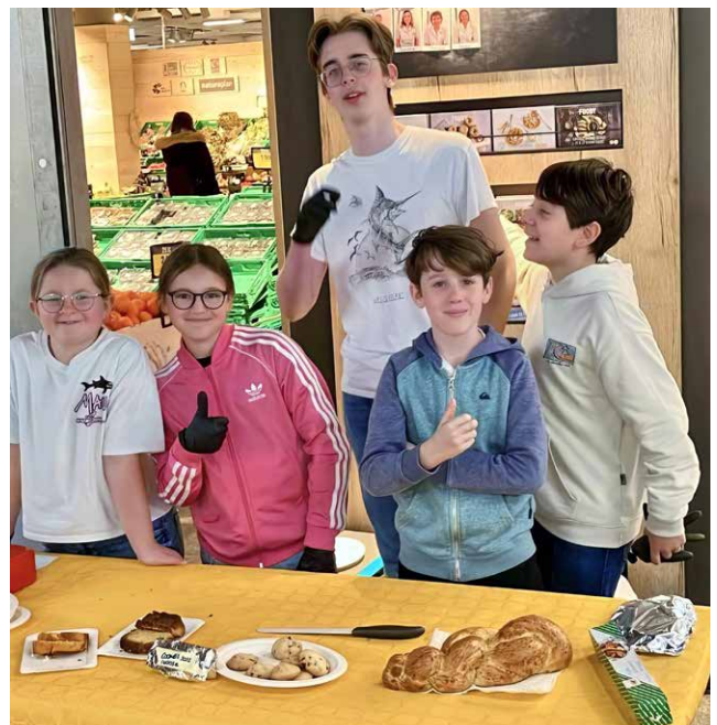
Vente de pâtisseries par les jeunes du centre d'Etoy (VD) en mars 2025.