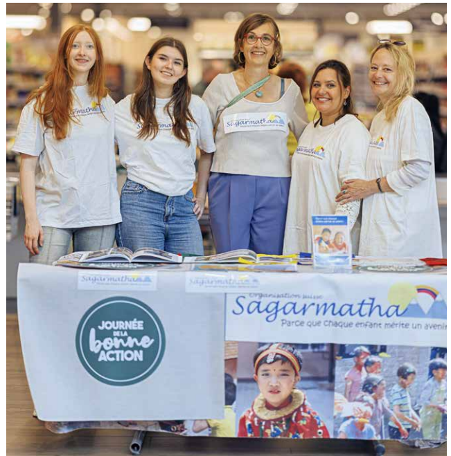
Journée de la bonne action 2025 à la Coop d'Allaman (VD).