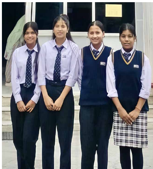
Quatre jeunes filles du centre Punarbal ont terminé leur scolarité et poursuivent leurs études pour deux ans.