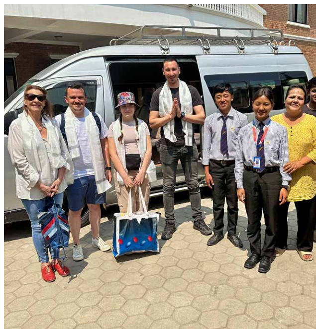
Lors de notre voyage au Népal en avril 2025, nous avons été chaleureusement accueillis dans les deux centres.

Nous remercions du fond du cœur toutes les personnes, entreprises et fondations qui nous ont aidés cette année.